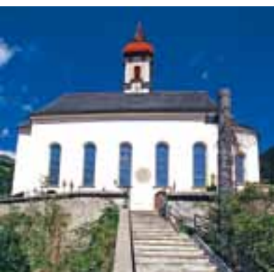
Pfarrkirche in Gossensass

Es verwahrt den größten Teil des bedeutenden spätgotischen Flügelaltars des Ulmer Bildhauers und Malers Hans Multscher von 1459.