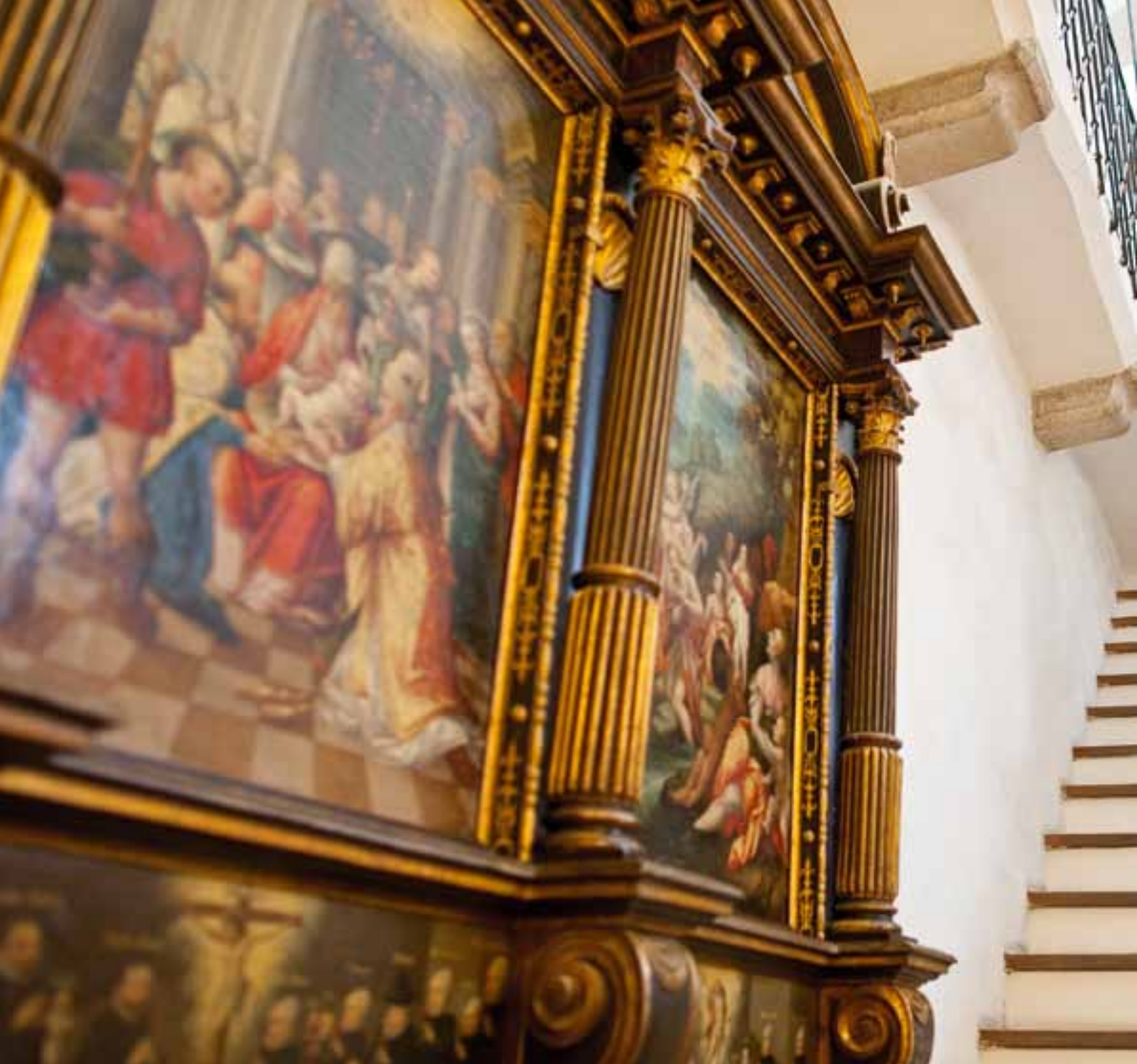
Das Sterzinger Rathaus